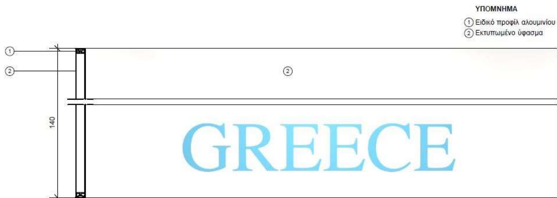
ΟΨΟΤΟΜΗ, ΚΛΙΜΑΚΑ 1.20 ΚΑΤΑΣΚΕΥΑΣΤΙΚΗ ΛΕΠΤΟΜΕΡΕΙΑ ΑΝΑΡΤΗΜΕΝΗΣ ΚΑΤΑΣΚΕΥΗΣ ΟΡΟΦΗΣ

Η επιλογή αυτού του τύπου κατασκευής πραγματοποιείται για τους εξής ιδιαίτερα σημαντικούς λόγους: Πρώτον, η δυνατότητα επανάχρησης της κατασκευής σε πολλαπλές εκθέσεις, προσφέρει το πλεονέκτημα της επανάχρησης των υλικών, συμβάλλοντας στον “πράσινο” χαρακτήρα του περιπτέρου και μειώνοντας σημαντικά το ενεργειακό αποτύπωμα της κατασκευής. Δεύτερον, ο συγκεκριμένος τύπος προσφέρει την δυνατότητα συναρμολόγησης και μεταφοράς με την χρήση επίπεδων στοιχείων και συσκευασιών, δίνοντας ευελιξία στην μεταφορά τους, καθιστώντας την πιο εύκολη και οικονομική, στοιχείο ιδιαίτερα σημαντικό σε μακρινούς διεθνείς προορισμούς. Τρίτον, αυτός ο τύπος προσφέρει χαρακτηριστική ευκολία και ταχύτητα κατά την διάρκεια της κατασκευής , μειώνοντας σε σημαντικό βαθμό το επίπεδο δυσκολίας και πολυπλοκότητας της κατασκευής, αλλά και τον χρόνο που απαιτείται για την συναρμολόγηση και αποσυναρμολόγησή της. Τέλος, χαρακτηριστικό γνώρισμα της εν λόγω κατασκευής είναι και η ευελιξία στον τρόπο κατασκευής και στην επιλογή επενδύσεων.